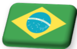
Figura 1 – O Brasil e o MERCOSUL em números

Nesse sentido, o Brasil é o país mais bem preparado para liderar e impulsionar um necessário processo de readequação da estrutura e operação do bloco, em conformidade com suas regras e princípios basilares, porém de forma a torná-lo um instrumento efetivo de inserção internacional – e não apenas sub-regional – do país. Da forma como está, o MERCOSUL não atende este objetivo. Assim, o Brasil deverá promover esforços junto aos outros membros do MERCOSUL, pautando uma agenda que aprimore o ambiente de negócios e fomente o crescimento econômico e os fluxos comerciais, tanto no âmbito intrarregional quanto extrarregional.